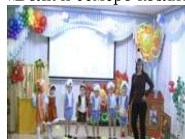
Группа №1 «Красная шапочка и волк Забивака»