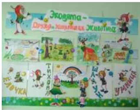
Группа № 2 «Почемучки»