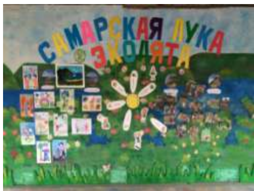
Группа № 8 «Сказка»

Всероссийский конкурс на лучший стенд (уголок) «Эколята - молодые защитники Природы» в дошкольных образовательных учреждениях проходил в сентябре 2018 г. В этом конкурсе участвовали подготовительная к школе группа № 8 «Сказка», подготовительная к школе группа № 5 «Веселые ребята», старшая группа № 2 «Почемучки». По итогам этого конкурса победителями стали группа № 8 «Сказка» (II место), группа № 2 «Почемучки» (II место).