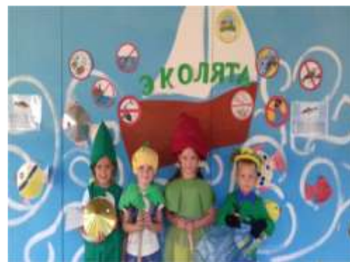
Группа № 5 «Весёлые ребята»

Традиционно родители вместе с детьми участвовали в конкурсе поделок из природного материала «Осенний лес». Поделок было так много, что они не помещались в главном холле детского сада. Голосование проходило 15 октября 2018 года, в котором принимали участие родители воспитанников детского сада. Выбор был очень трудным.