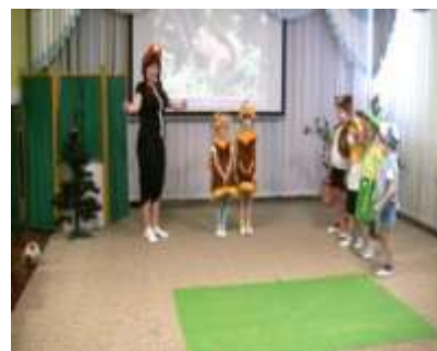
Группа № 6 «Как звери готовились к лесному футболу»