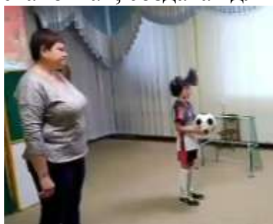
Группа № 9 «Интерактивное представление. Забей Забиваке»

Начиная с 2017-2018 учебного года педагогами нашего дошкольного учреждения было принято решение, что воспитанники должны сами активно участвовать в театрализованных представлениях в рамках фестиваля «Навстречу FIFA-2018». Педагоги провели огромную творческую работу со своими маленькими воспитанниками: актёрами и зрителями, привлекая детей и родителей к участию в различных театрализованных постановках, создавая для них настоящий праздник!