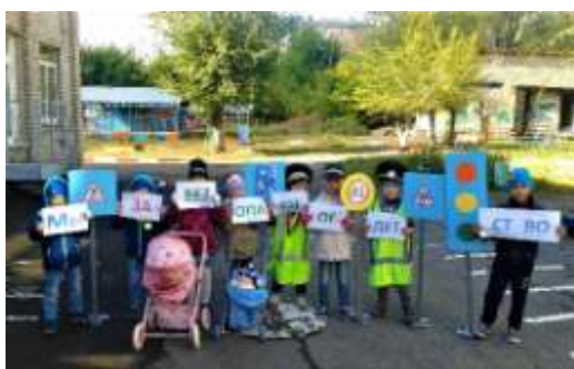
Снимаем видеоролик «В мире знаков»