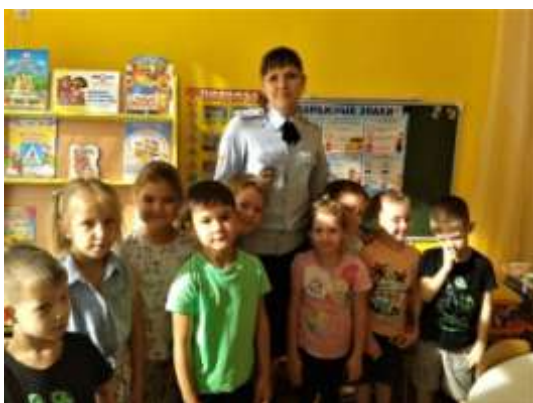
Познавательная встреча с сотрудником полиции

А также участвовали в районном этапе городского конкурса «Безопасное колесо» и заняли III место.