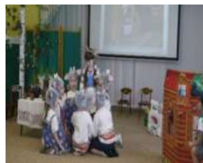
Группа №7 «Волк и семеро козлят»