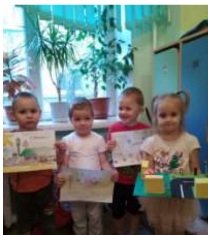
Наши рисунки и поделки