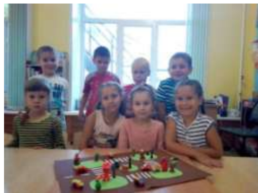
Конструирование «Дорога в детский сад»