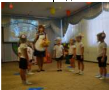
Группа № 8 «Волк и семеро козлят на новый лад»