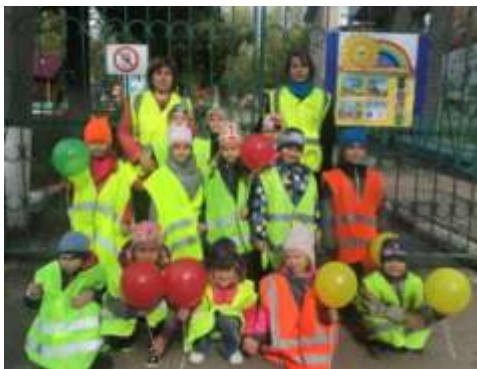
Акция «Красный, желтый, зеленый»