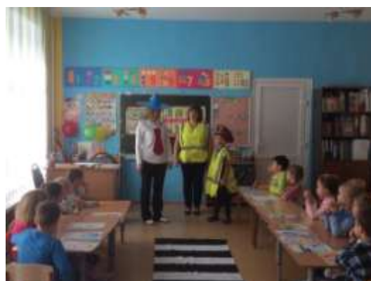
Изучаем с Незнайкой правила дорожного движения