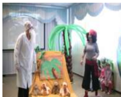
Группа №10 «В гостях у Айболита»