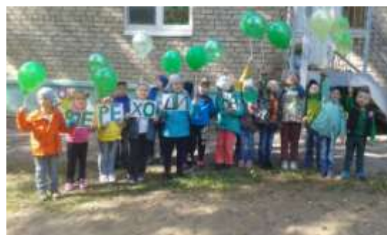
Акция «Переходи на зеленый»