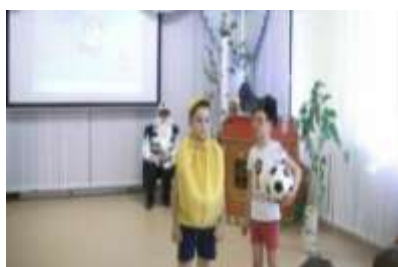
Группа №3 «Колобок на новый лад»