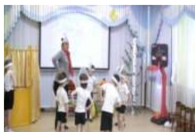
Группа №4 «Однажды в Простоквашино»