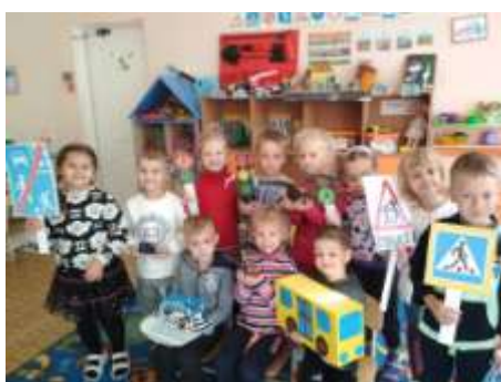
Игра «Юные пешеходы»