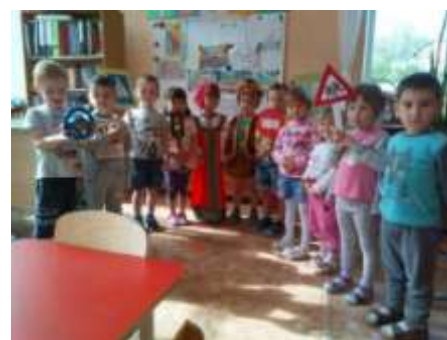
Развлечение по ПДД с Машей и Медведем