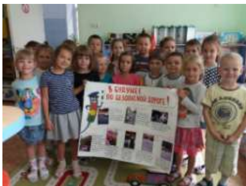
Стенгазета «Безопасная дорога»